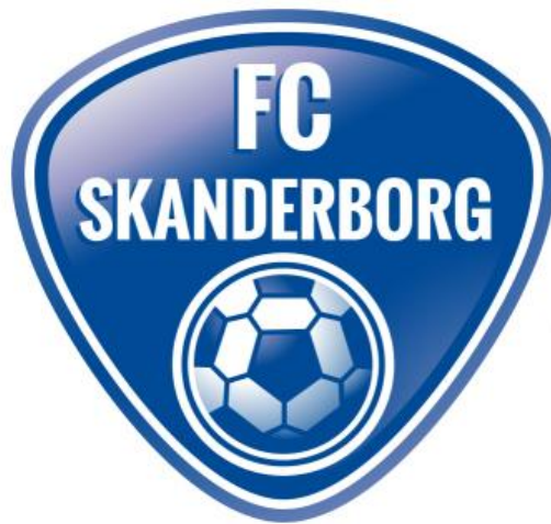
U12 Træningsprincipper Fordeling