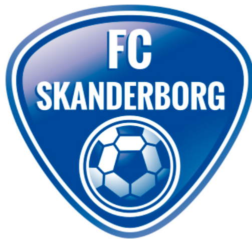
U14 Træningsprincipper Fordeling